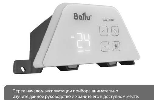
Перед началом эксплуатации прибора внимательно изучите данное руководство и храните его в доступном месте.