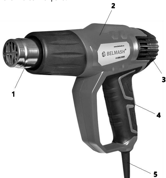
Рисунок А. Общий вид фена

Для выполнения специфических работ в наборе предусмотрены специальные технологические насадки, которые при необходимости устанавливаются на сопло фена.