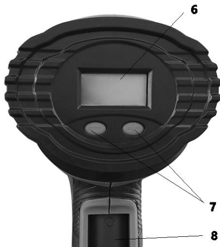
Рисунок В. Устройства управления и регулировки

1 – сопло, 2 – корпус, 3 – вентиляционные отверстия, 4 – рукоятка, 5 – кабель