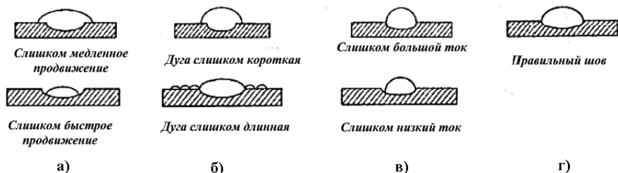
Рисунок 3. Типы сварочных швов.

7.7. При правильном выборе скорости сварки и силы тока шов получается необходимой ширины без деформаций и кратеров, см. рис. 3г.