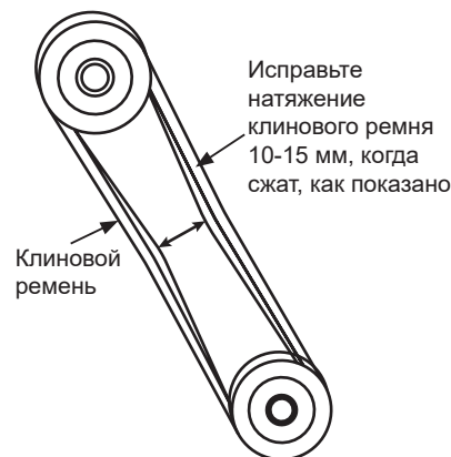
Рис. 2 Натяжение клинового ремня

После 200 часов работы снимите верхнюю крышку ремня, чтобы проверить натяжение клинового ремня (Рис. 2). Натяжение верное, когда ремень сгибается примерно на 10 мм при сильном сжатии пальцами. Ослабленный или изношенный клиновой ремень уменьшает эффективность передачи мощности, что приводит к плохой трамбовке и уменьшает срок службы самого ремня.