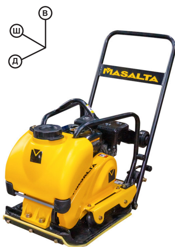
Серия MSR90: 110 x 50 x 83 см