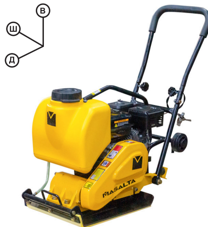
Серия MSR60: 100 x 40 x 80 см