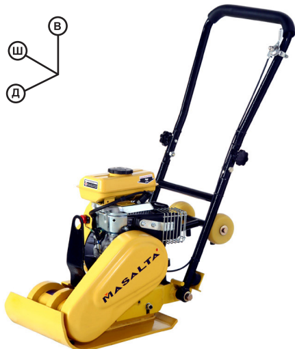
Серия MS50: 90 x 31 x 88 см