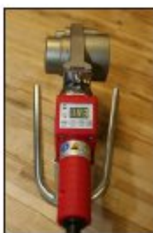
ROWELD P 63 Set