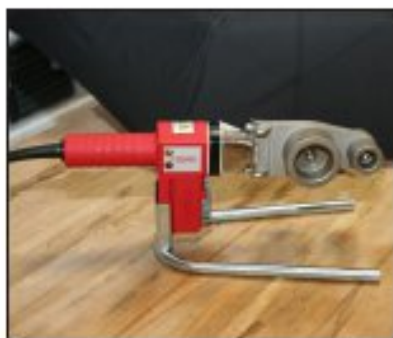
ROWELD P 40 Set