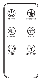
Прибор поставляется с пультом управления.