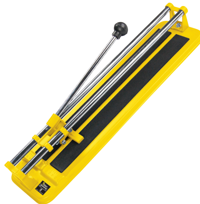
Плиткорез ручной KTC 400