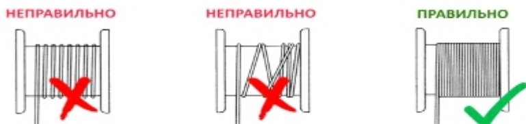
Рисунок 3. Намотка троса на катушку.

Лебедка модели FD оснащена храповым механизмом, препятствующим произвольному вращению барабана. При работе с лебедками категорически запрещается снимать фиксатор храповика.