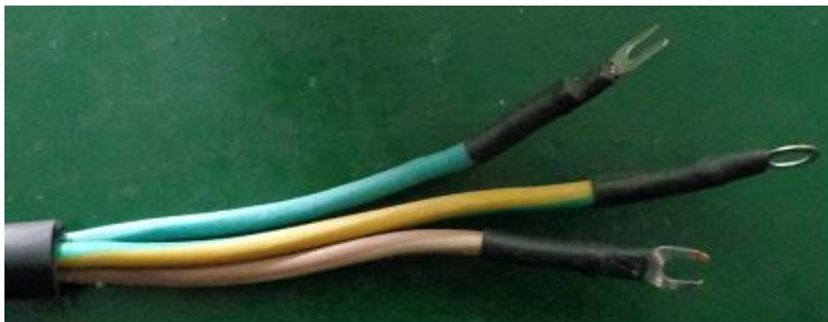
3 провода однофазного силового кабеля: коричневый, синий и желто-зеленый

Устройство, оборудованное силовой вилкой, подключается к обычной розетке. Однако от обычной бытовой 16-амперной розетки 220В возможна работа только в режиме зарядного устройства 12-вольтовых батарей. Пусковой режим даже автомобилей с сетью бортового питания 12 вольт требует более мощного источника питания, чем обычная розетка, рассчитанная максимум на 3.68кВА. Как правило, таким источником служат специальные силовые выводы на электрощитке. Однофазная модель 1000А и трехфазная 1500А поставляются без силовой вилки.