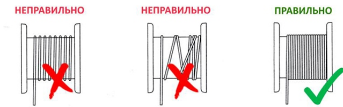
Рисунок 3. Намотка троса (ленты) на катушку.

Лебедка модели LRB оснащены храповым механизмом, препятствующим произвольному вращению барабана. При работе с лебедками категорически запрещается снимать фиксатор храповика.