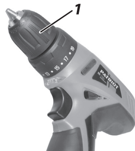
1. Патрон быстрозажимной (втулка).