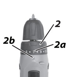
2. Муфта регулировки; 2a. Градуировка; 2b. Указатель.

Усилие затяжки может быть отрегулировано на одно из 19 положений путем поворота регулировочного кольца (2) так, чтобы одна из его градуировок (2a) совпала со стрелкой (2b) на корпусе инструмента. Для настройки минимального усилия затяжки совместите цифру 1 с указателем, для настройки максимального усилия затяжки - маркировку 19 с указателем. Муфта будет проскальзывать при различных усилиях затяжки от 1 до 19. Она разработана таким образом, что не будет проскальзывать на отметке «сверло». Для того, чтобы определить усилие затяжки, соответствующее выполняемой работе, перед выполнением работы сначала закрутите пробный шуруп в материал или в деталь из аналогичного материала.