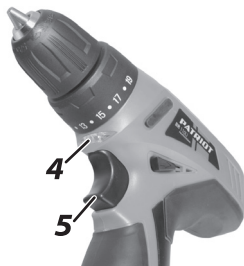
4. Лампочка подсветки;