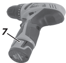
7. Кнопка для снятия аккумулятора

Перед установкой/снятием аккумулятора всегда отключайте инструмент. Для снятия блока аккумуляторов, выньте его из инструмента, нажимая на кнопку на аккумуляторном блоке (Рис. 2).