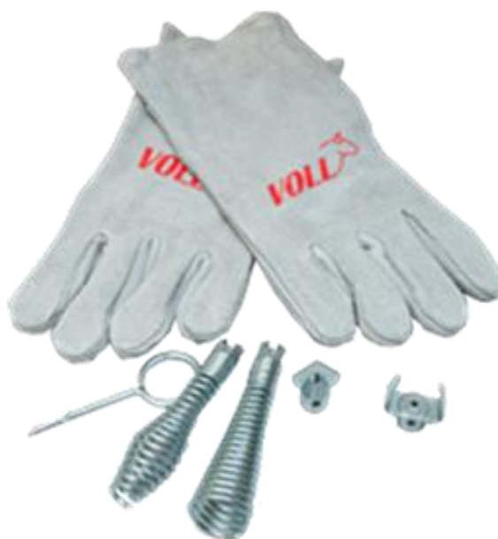
Комплект насадок и защитные рукавицы (краги)