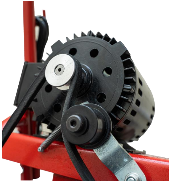
Ременная передача от электродвигателя

Прочистная машина V-Clean 100 электро служит для прочистки труб диаметром от 32 до 100 мм и длиной до 25 метров. Устойчивый к коррозии барабан помещается 25м спирали диаметром 10 мм. Спираль вращается со скоростью 140 об/мин. Модель V-Clean 100 электро не предназначена для очистки труб, заросших корнями. Привод барабана осуществляется ременной передачей от электродвигателя мощностью 350 Вт.